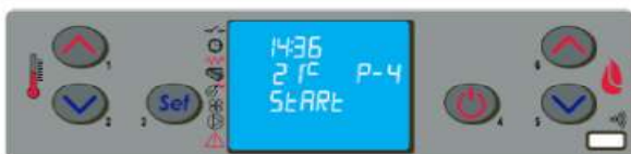
Табло за управление