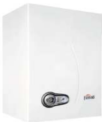
Модел 25 К за стенен монтаж

Газова термична група с вграден бойлер 50 литра от неръждаема стомана кондензен модел