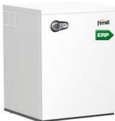
Модел В 32 К за стоящ монтаж